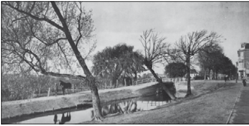
De La Reykade in 1929 met rechts bebouwing

een groot aantal jaren aan de De La Reykade, de tegenwoordige De La Reyweg, die toen nog een polderweg langs een vaart was met aan één kant nieuwbouw: de verrijzende Transvaalwijk. In deze nog landelijke omgeving heeft hij menige schets gemaakt als basis voor een schilderij. Hij trok er echter ook wel eens op uit om stads- of dorpsgezichten op het doek te zetten. Het is overigens niet bekend wanneer precies Jan Knikker sr. en zijn echtgenote hun intrek namen aan de Ooievaarlaan.