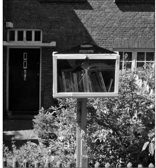
Het boekenkastje aan de Houtrustlaan