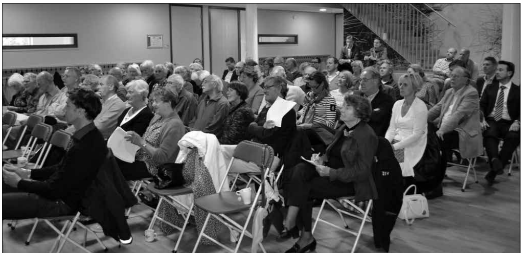
Een aandachtig gehoor tijdens de algemene ledenvergadering.

(een soort 'actiekas' voor bijvoorbeeld onvoorziene advocaatkosten) om daarmee een Vogelwijk Cultuurfonds in het leven te roepen. Het exploitatieverlies van het wijkblad, dat in 2013 nog bijna 12.000 euro bedroeg is in 2014 gehalveerd omdat enerzijds het in de crisisjaren sterk afgenomen advertentievolume weer enigszins is gegroeid en anderzijds flink op de druk- en verzendkosten is bespaard. Het aantal leden blijft al enige jaren ongeveer op het zelfde niveau van plusminus 1750, en dat ondanks wanbetalers die zelfs herhaalde verzoeken negeren om de jaarcontributie van